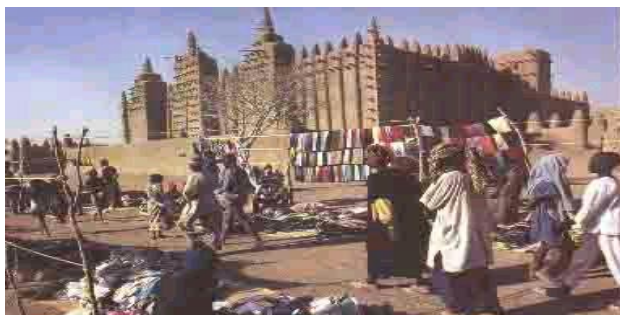
Malí, zona del Sabel, al borde del Sahara